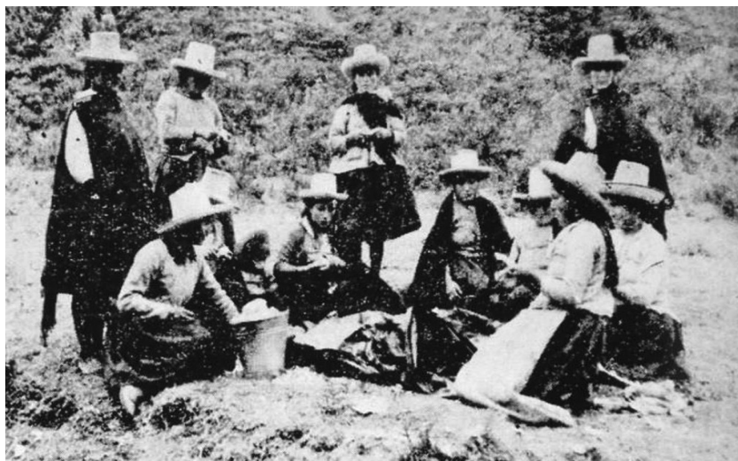
Figura N° 4: Grupo de campesinos lectores

En el N° 30 (1981), escribe «Bibliotecas Rurales. Modelo de servicio bibliotecario en el campo. Cajamarca», donde expone un documental realizado gracias al apoyo de la Organización de los Estados Americanos y el Convenio Andrés Bello, en el que se detalla la historia de Cajamarca, la descripción de las bibliotecas rurales y la promoción de servicios bibliotecarios como testimonio de la Red de Bibliotecas Rurales de Cajamarca. Este trabajo de bibliotecas rurales traspasó fronteras, es por ello que escribe sobre la visita de la coordinadora de la Red de Bibliotecas Públicas del Estado de Táchira, Venezuela (N°s 32-33, 1982), quien visitó el Perú para conocer y estudiar el trabajo de las redes de bibliotecas de Cajamarca.