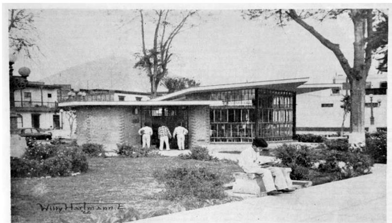
Figura N° 2: Estación Bibliotecaria «Malecón Rímac».

Siguiendo con el servicio de extensión bibliotecaria, en el año 1967 sigue informando sobre el apoyo a otras bibliotecas de Lima Metropolitana y Callao y provincias. Así, en el N° 20 (1969), describe el local de la Estación Bibliotecaria Benito Juárez, ubicada en el parque Ricardo Palma de la urbanización Repartición (Comas), y destaca el apoyo de la Biblioteca Municipal de San Isidro a esta biblioteca mediante la donación de 435 libros infantiles. Asimismo, da cuenta de la Biblioteca Juan Pablo Vizcardo y Guzmán de Villa María del Perpetuo Socorro (N°s 13-14, 1966), considerada biblioteca mínima por ser un pequeño local de préstamo de libros.